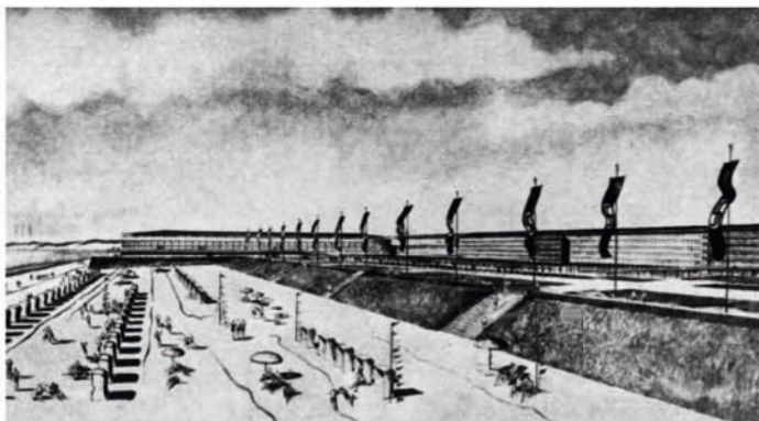
"KdF-strandbad" Rügen, architectuurperspectief van het ontwerp van Clemens Klotz, 1936

Het ongeveer 4,5 km lange gebouw van het "KdF-strandbad" werd in opdracht van de nationaalsocialistische gemeenschap Kraft durch Freude (Kracht door Vreugde, KdF) van 1936 tot 1939 gebouwd en voor het grootste deel opgeleverd. 20.000 mensen zouden hier vakantie kunnen vieren. Het "KdF-Strandbad" is niet alleen een goed voorbeeld van het gebruik van moderne architectuur tijdens het nationaalsocialisme, maar ook een sociaalhistorische poging om de arbeidersklasse, waarvan de partijen en organisaties in 1933 waren opgeheven, te winnen voor het oorlogs-, rassen- en Lebensraumbeleid (leefruimte voor het Duitse volk) van het bewind. Het volk zou uit Prora kracht kunnen putten voor de volgende oorlog.