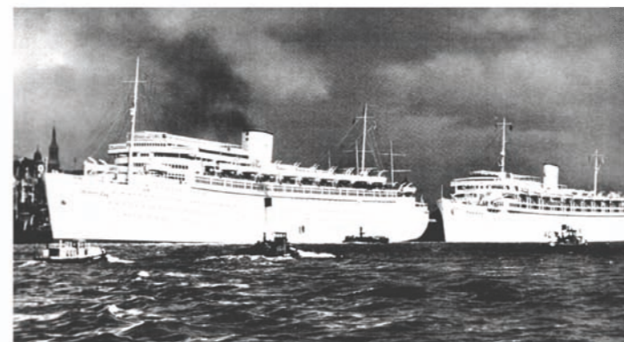
Vakantieschepen gebouwd voor de "KdF"-organisatie: "Robert Ley" en "Wilhelm Gustloff", 1939

Bij de Duitse herdenking werden tot nu toe alleen de misdaden van het "Derde Rijk" beschreven. Het doorgronden van de beloftes en de beloften van het regime – met de klasseloze "Volksgemeenschap", de deelname aan cultuur, reizen, consumptie, techniek, en motorisering als voorwendsels – is onontbeerlijk voor het begrip