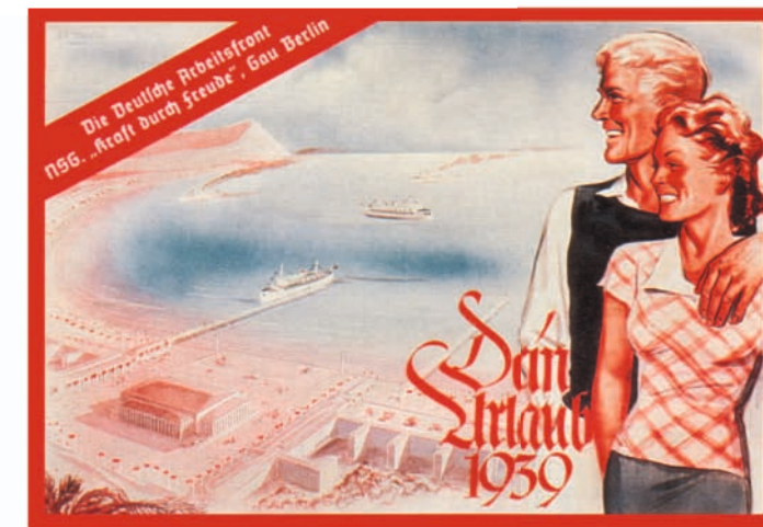
"KdF"-reclame van 1939. Op de achtergrond het complex van Prora

Dat Prora als "KdF-bad" niet in gebruik werd genomen is geen tekort aan authenticiteit, maar het gevolg van het expansionistische en racistische beleid van het "Derde Rijk", dat een grotere dynamiek ontwikkelde dan te zorgen voor de "volksgemeenschap". Het mislukken van het sociale beleid van het nationaalsocialistische regime is een logisch gevolg van het beleid van het "Derde Rijk". Het gebouw is hier een goed bewijs voor. De prijs van de "schone schijn" waren volkerenmoord, massagraven en een breuk met de beschaving.