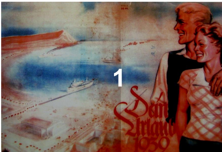
1 KdF-annonsering 1939. Byggnaderna i Prora, varvet och landningsbron betonas i bakgrunden.