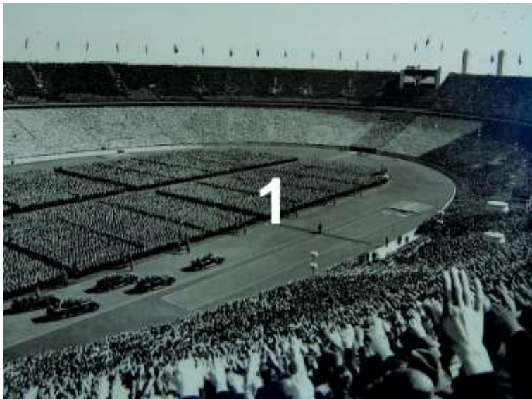
1. Ungdomsrally i Olympia Stadion Berlin den 1 maj 1939

Den "tyska Volksgemeinschaft" ("Folkets gemenskap") inom den nationalsocialistiska ideologin var en konstruerad idé. Den var avsedd att inkludera alla "rena" tyskar och bygga upp ett klasslöst samhälle mellan arbetare och intellektuella. Befolkningen skulle underordna sig detta mål. "Folkets gemenskap" innebar dock inte lika rättigheter för alla, utan strikt underordning under ledarskapsprincipen. Vägran att acceptera "Folkets gemenskap" resulterade i kraftiga påföljder. En enskild "Volksgenosse" betydde ingenting; de nationalsocialisterna strävade efter en smidig massa. Konstruktionen "Folkets gemenskap" var nära kopplad till militära perspektiv. Den skulle garantera yttre försvar och spara och bevara makten internt. Termen "Folkets gemenskap" var inte uppfunnen av nationalsocialisterna utan perverterades - liksom många andra termer - av nazisterna.