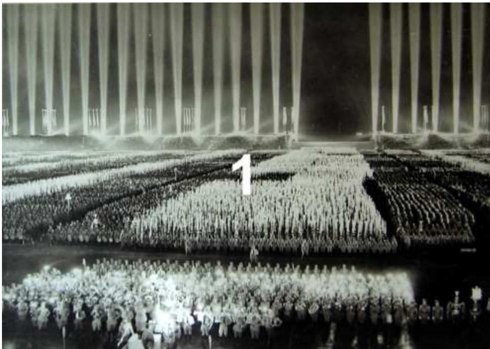
1. Ljuskupolen under "Nürnbergrallyt" i Nürnberg, 1936. Rudolf Herz, München

Terror var inte den enda egenskapen hos det nazistiska regimen. Masskultur och den ständigt närvarande propagandan var också kännetecknen. Inspirerade av Wagneroperor; filmmanus, teatereffekter, reklam, politiska händelser och massmöten skulle iscensättas. Massframträdanden, uniformer, den oändliga havet av flaggor, ljuseffekter, läktare, upphöjda piedestaler, förprogrammerade gester och effektiv musik skulle omvandlas till en överväldigande spektakel, ett verk av 'konst'. Führers framträdanden, festivaler, minnesmärken och alla typer av masshändelser skulle upprepas frekvent, så att folket inte skulle kunna reflektera över vad som händer. Detta ledde till skapandet av en illusorisk värld, använd för att skapa "Folkgemenskapen". Nära den nationella socialisternas iscensättning av masshändelser fanns alla möjliga idrottstävlingar och presentationer av konst, kultur och teknik. Men även detta skulle genomsyras av nazistsymboler och emblem. För att upprätthålla denna fiktiva verklighet och distrahera från vardagslivet skulle stora mängder pengar och fantasi spenderas av det tredje riket. Detta kostade mer pengar, till en viss grad kan man också säga mindre pengar, än att investera i att förbättra arbarklassens sociala förhållanden. Denna massunderhållning skulle ge "Folkgemenskapen" en pseudosocialistisk beläggning.