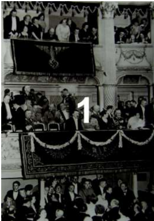
1. Hitler under öppnandet av Riksteaterveckan i Dresden, 1934. Tyska historiska museet

Högkultur spelade en viktig roll i att förädla estetiken i politiken och bidrog till den falska bilden av regimen. Hitler's maktövertagande ledde till att många utsatta och rasdiskriminerade konstnärer, vetenskapsmän och intellektuella emigrerade. Förlusten av kreativitet och konstnärlig och kulturell potential var stor, och den nationalsocialistiska mediokriteten kunde inte ersätta detta. Den kulturella effekten förväntades vara propagandaorienterad. Antingen genom teman och motiv som stödde världsåskådningen, eller via underhållande ämnen som upprätthöll bilden av en "fredlig" värld. Det var inte bara de nationalsocialistiska konstnärerna som förstärkte den fasad som Goebbels ministerium för propaganda och information hade som mål. Konstnärer som levde endast för sin konst eller som var tillbakadragna skulle, så länge de inte kritiserade nationalsocialistens doktrin, utnyttjas internt och externt. Annars hotades de med utvisning från Rikskulturkammaren och fick inte utöva sitt yrke. Den engagerade och demokratiskt orienterade konsten från 1933 skulle utplånas. Fasaden av en civiliserad kultur upprätthölls så långt den var användbar för regimen. Kulturella och konstnärliga prestationer från "Tredje riket" kan definieras som regressiva, bristfälliga i humanism, pacifism och emancipation.