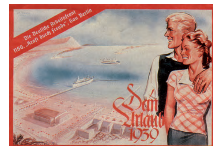
KdF-reklamaffisch från 1939. I bakgrunden Proras byggnader

de ofattbara våldsbrotten, av modernitet och barbari, ger en bild av "Tredje riket" som är begriplig för kommande generationer. Mer än ett halvt sekel efter krigsslutet lever myten om "Tredje rikets" påstådda goda sidor och sociala landvinningar kvar. Prora är den plats där denna myt, som fortfarande har en inverkan, kristalliseras i monumental arkitektonisk form. Denna myt stämmer dock inte överens med den sociala verkligheten i det nationalsocialistiska samhället, som kännetecknades av social ojämlikhet och uteslutning av hela befolkningsgrupper. Ideologin om "folkgemenskapen" frammanade en rasmässigt och politiskt homogen gemenskap som skulle vara lojal och lydig mot "Führer" och ha rätt till sociala förmåner som semester i Prora. Det förringar inte platsens autenticitet att Prora inte togs i bruk som en "KdF-badort" på grund av det krig som startades och sedan förlorades av nazistregimen. Från 1936 och framåt var det ett ständigt ämne för propaganda för de sociala löften som regimen lovade för framtiden. Många historiska spår håller på att försvinna till följd av dagens ombyggnadsprocesser. Det gör det ännu viktigare för ett dokumentationscenter att ge ett historiskt sammanhang.