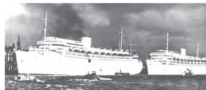
Nya fartyg av KdF "Robert Ley" och "Wilhelm Gustloff", 1939

Fritidsorganisationen "Kraft genom glädje" blev genom sina erbjudanden den populäraste och mest framgångsrika delen av den "Tyska arbetsfronten". Havsbadet i Prora var fram till 1939, liksom folkbilen, ett väsentligt inslag i regimen sociala propaganda. Det är betecknande att grundläggningssceremonin i Prora genomfördes den 2 maj 1936, på treårsdagen av nazisternas våldsamma upplösning av fackföreningarna, den s.k. stormen mot fackföreningarna. Men havsbadet och folkbilen kom enbart att bli propagandistiska medel och blev aldrig förverkligade.