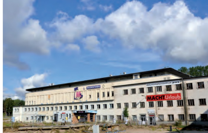
Prora dokumentationscentrum, 2019