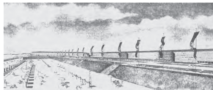
"KdF-Seebad Rügen", arkitektonisk perspektiv baserat på design av Clemens Klotz, 1936

I badorten Prora byggdes mellan åren 1936 och 1939 ett 4,7 kilometer långt komplex, som skulle kunna härbärgera 20 000 semesterfirare. Uppdragsgivare var den nationalsocialistiska organisationen "Kraft genom glädje" ("Kraft durch Freude", KdF). Till största delen hann byggnaden bli färdig före krigsutbrottet. Anläggningen är inte bara ett byggnadshistoriskt intressant exempel på hur modernismens arkitektur användes under nationalsocialismen utan ger också socialhistoriskt viktig information. "KdF-havsbadet" vittnar om nazisternas bemödanden att vinna arbetarna - vilkas partier och organisationer slogs sönder 1933 - för en nazistisk krigs-, livs- och raspolitik. "Folkets nerver" skulle stärkas inför nästa krig.